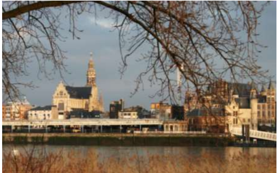
Skyline Februari 2009