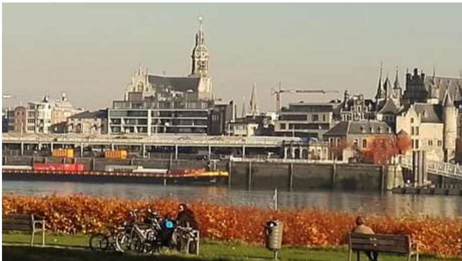
Skyline November 2015