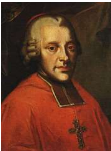
Hieronymus von Colloredo

Nadat hij achttien maand op reis was geweest, onder andere naar Parijs (waar Mozarts moeder, die hem op de reis begeleidde, stierf op 57-jarige leeftijd) en Mannheim - op zoek naar werk maar zonder veel succes - werd Mozart op voordracht van zijn vader benoemd tot hoforganist en kapelmeester van de kathedraal van Salzburg. Hij componeerde meteen de mis in C KV 317: een prachtige werk dat zich zeer vrij ontwikkelt binnen de restricties van het concept van de 'missa brevis'.