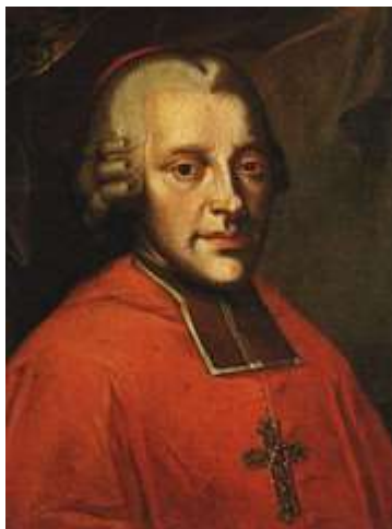
Hieronymus von Colloredo

Nadat hij achttien maand op reis was geweest, onder andere naar Parijs (waar Mozarts moeder, die hem op de reis begeleidde, stierf op 57-jarige leeftijd) en Mannheim - op zoek naar werk maar zonder veel succes - werd Mozart op voordracht van zijn vader benoemd tot hoforganist en kapelmeester van de kathedraal van Salzburg. Hij componeerde meteen de mis in C KV 317: een prachtige werk dat zich zeer vrij ontwikkelt binnen de restricties van het concept van de 'missa brevis'.