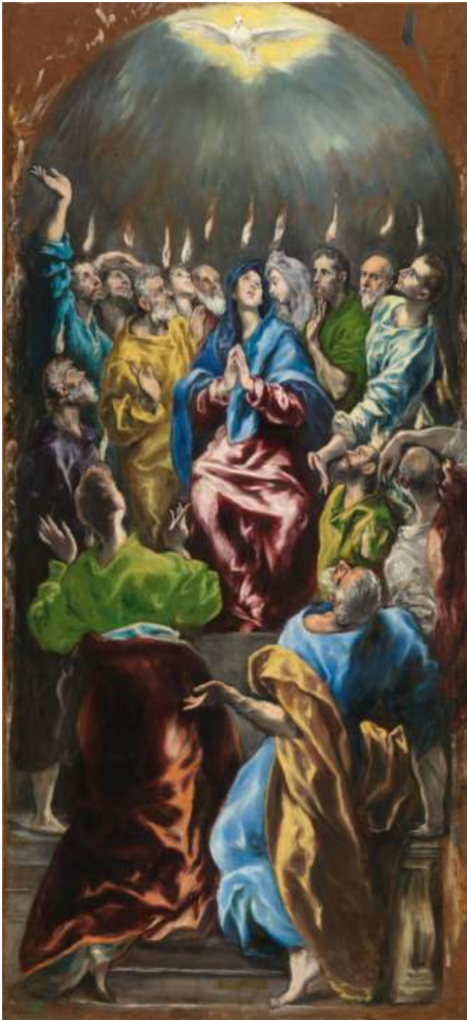
Domenikos Theotokopoulos, El Greco