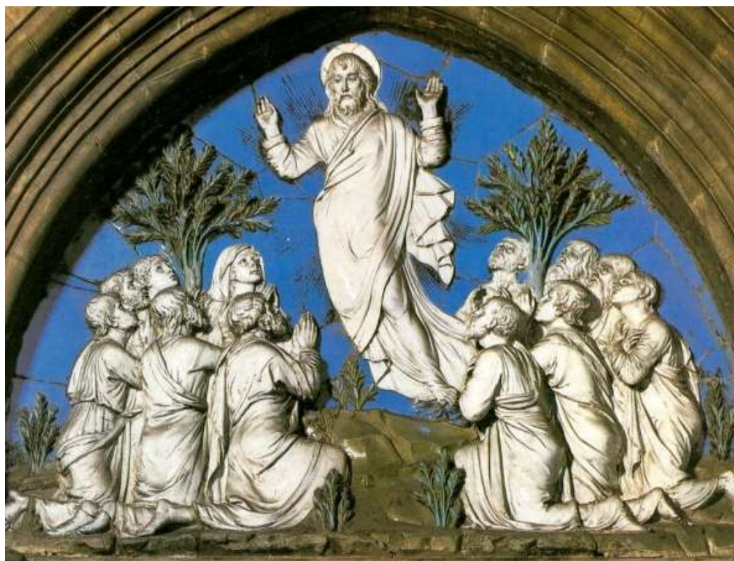
Luca della Robbia 1400 - 1482